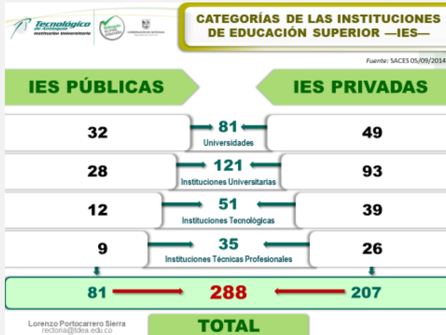
Figura 1: Categorías de IES en Colombia

De ellas, algunas tienen categoría de establecimientos públicos y 19 son de régimen especial como la Escuela Superior de Administración Pública, el Instituto Caro y Cuervo y otras militares, es decir, el sistema de educación superior del país está integrado por 81 instituciones de educación superior de carácter público, tal como lo muestra la Figura 2.