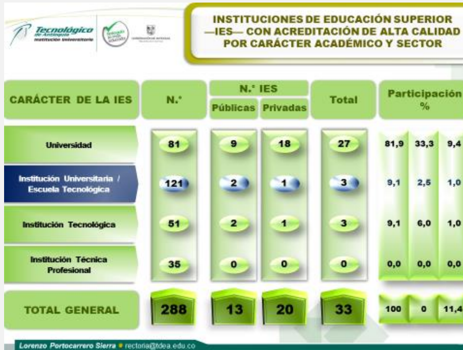
Figura 6. IES con acreditación de alta calidad por carácter académico y sector.

Por lo anterior, es necesario atender algunos aspectos con urgencia: