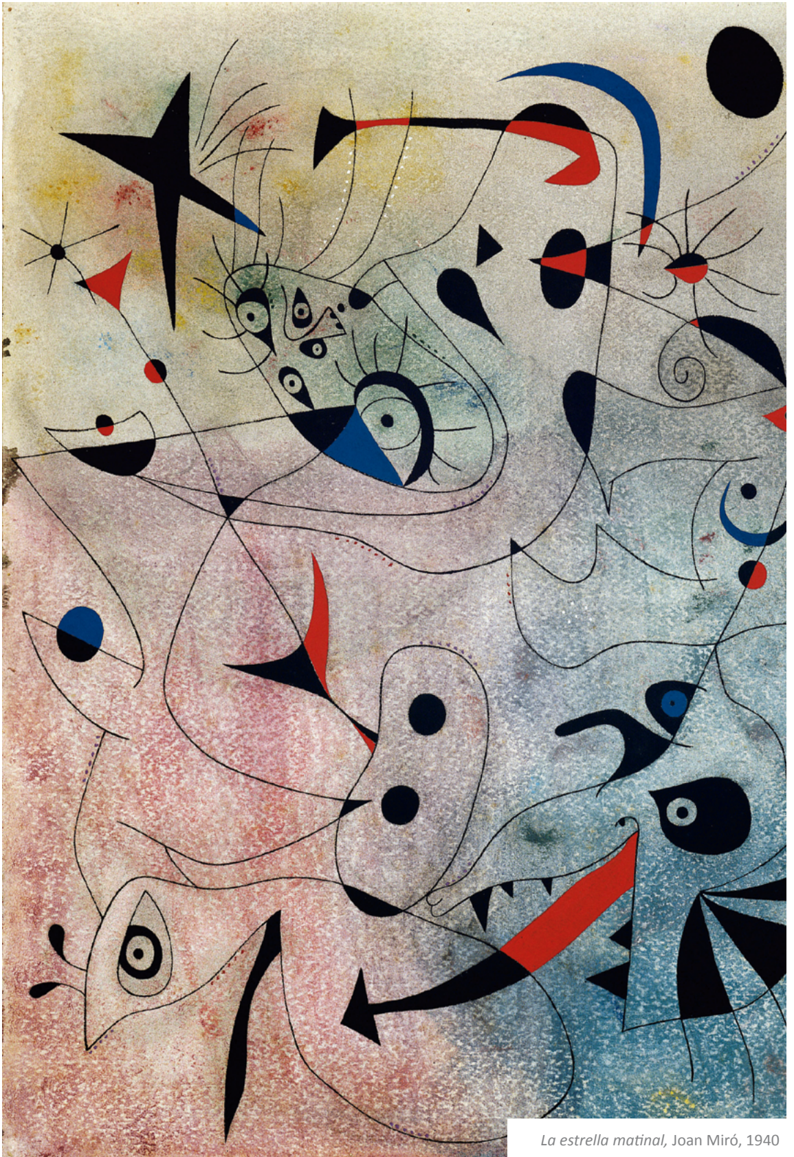
La estrella matinal , Joan Miró, 1940