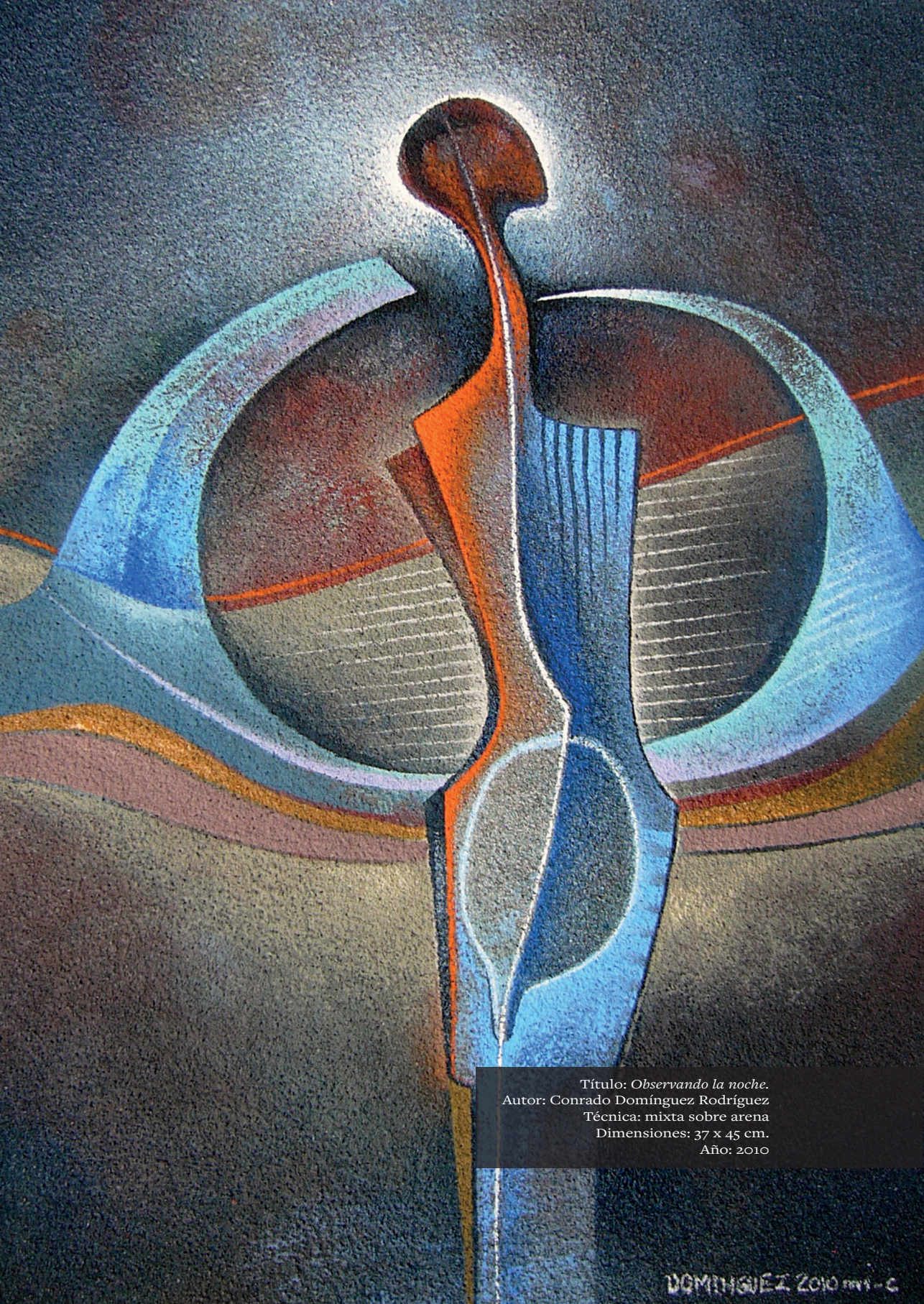
Título: Observando la noche. Autor: Conrado Domínguez Rodríguez Técnica: mixta sobre arena Dimensiones: 37 x 45 cm. Año: 2010