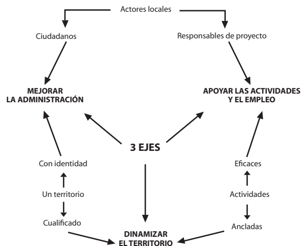
Figura 3. Estructura de la APT

El asomo de vertientes que tratan de simular el papel del administrador público territorial tras profesiones circundantes en cabeza de las ciencias políticas y el derecho, entre otras, pone en aprietos el papel de administrador, gerente y gestor en el que debe ubicarse el administrador público territorial. Sin capacidad de identificar plenamente los obstáculos sobre los cuales debe atender el Estado, gobierno y sector público, es imposible elevar la figura profesional del APT. Y en suma, las condiciones de formación, preparación y resultados que a costas deben llevar este, sobrepasan en muchos de los casos, las condiciones y cualidades que finalmente adquiere el profesional egresado de APT. El saber de otras disciplinas, es sólo una manifestación normal para quien desde el Estado debe tener presente la interdisciplinariedad. (ver Figura 3)