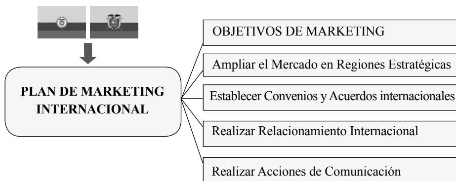
Figura 2. Modelo de Internacionalización para el Hospital Pablo Tobón Uribe

Según los análisis realizados, el Hospital Pablo Tobón Uribe puede ingresar al mercado de Ecuador y gracias a la Misión Institucional que está enfocada en la persona, se puede aplicar el plan de marketing enfocado en el cliente, basado en sus necesidades específicas de traslado y aplicando una experiencia relacional dentro de su estadía en el HPTU. El Modelo que se plantea para llegar al mercado en el país vecino, es de construcción de las autoras, bajo el Plan Estratégico de Exportación de Servicios Médicos (Alvarez, 2013). El trabajo que se debe realizar es muy específico y está enfocado en mercadeo estratégico.