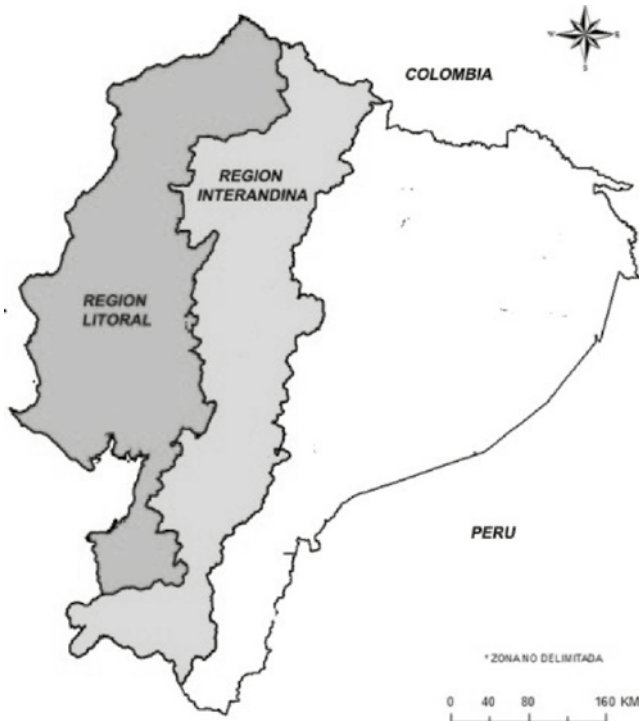
Figura 3. Regiones Territoriales de mayor desarrollo económico y social en Ecuador PROECUADOR, 2014.

El Hospital Pablo Tobón Uribe se debe focalizar en las seis (6) provincias de estas dos regiones en donde están ubicados los hospitales y clínicas más prestantes, con los que se debe hacer negociaciones que permitan ampliar el posicionamiento de marca del Hospital y puedan remitir a los pacientes diagnosticados con enfermedades catastróficas como se definen en Ecuador y posteriormente realizar el tratamiento según las indicaciones médicas.