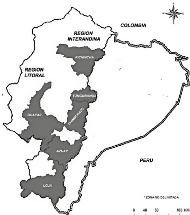
Figura 4. Provincias de mayor relevancia para aplicar la estrategia de Internacionalización del Hospital Pablo Tobón Uribe