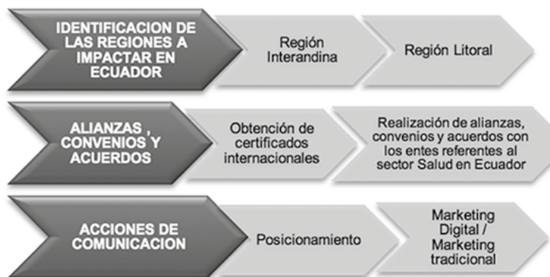
Figura 5. Etapas del proceso de internacionalización del Hospital Pablo Tobón Uribe

El marketing digital se puede implementar por medio de la página web de la institución de forma óptima, de tal manera que se pueda generar un posicionamiento en Ecuador, puesto en marcha y seguimiento de solicitudes de los pacientes internacionales e implementación y utilización de campañas electrónicas, aprovechando la inclusión de las TIC's. Dentro de esta estrategia, se debe tener en cuenta el historial de las exportaciones de pacientes del Ecuador en el Hospital, las fluctuaciones, costos y precios de la competencia que, según los resultados de los estudios realizados, están a favor para Colombia. El posicionamiento de la exportación de servicios de salud se debe establecer con el valor diferencial que en este caso es la misión institucional del Hospital que permite que el paciente tenga un trato especial y su reconocimiento como ser humano, agregado a la experiencia relacional que se percibe dentro del Hospital; así mismo iniciar la sensibilización y promoción del portafolio de servicios internacionales en Ecuador. Una vez realizadas estas estrategias se plantean las etapas del proceso de internacionalización que se debe implementar.