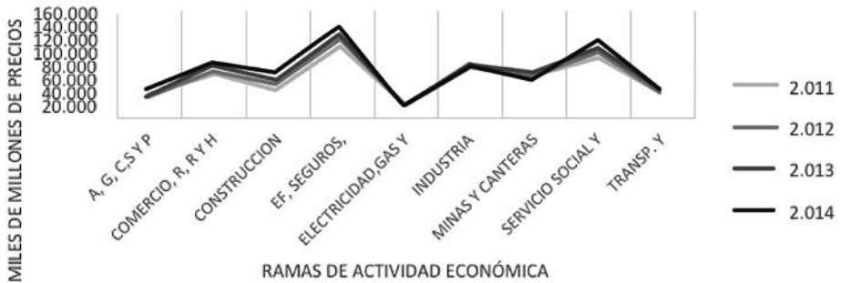
Figura 1: Crecimiento económico en Colombia por sectores

nacional, los entes tanto públicos como privados y la creciente necesidad de la sociedad en general por expandirse hacia nuevas oportunidades de negocio que se enfocan en el trabajo de programas de renovación urbana y de vivienda. En este sentido y a través de dicho crecimiento se favorecen los demás sectores generando de esta manera desarrollo y crecimiento a nivel global en la economía (Umaña, 2003, p.1).