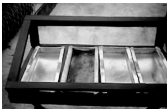
Figura 1. Bandejas de acero inoxidable para evaporación

38 cm x 12 cm x 2 cm, con capacidad para 900 ml cada una, las cuales fueron colocadas en una estructura de madera y cubiertas por una superficie de vidrio; esta última sirve primero como elemento protector y segundo como pantalla para la transmisión de luz y de calor, aumentando la temperatura en la bandeja, factor esencial para el proceso.