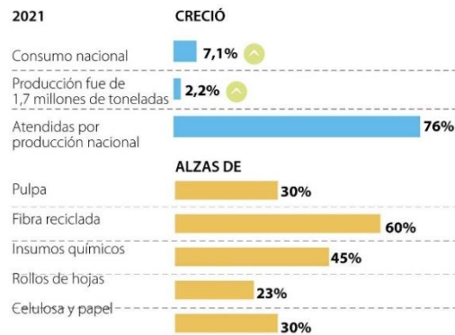
Gráfica 3. Impactos de la inflación en la industria del papel

Fuente: Cámara de la Industria de Papel y Cartón de la Andi / Gráfico: LR-MN